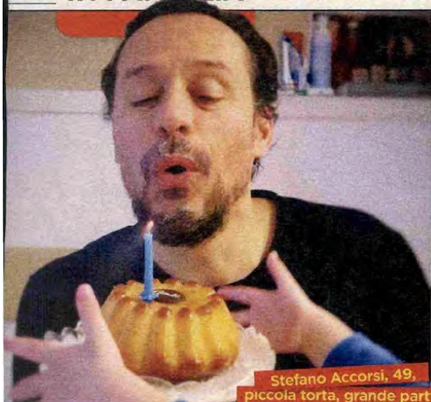
Stefano Accorsi, 49, piccola torta, grande party